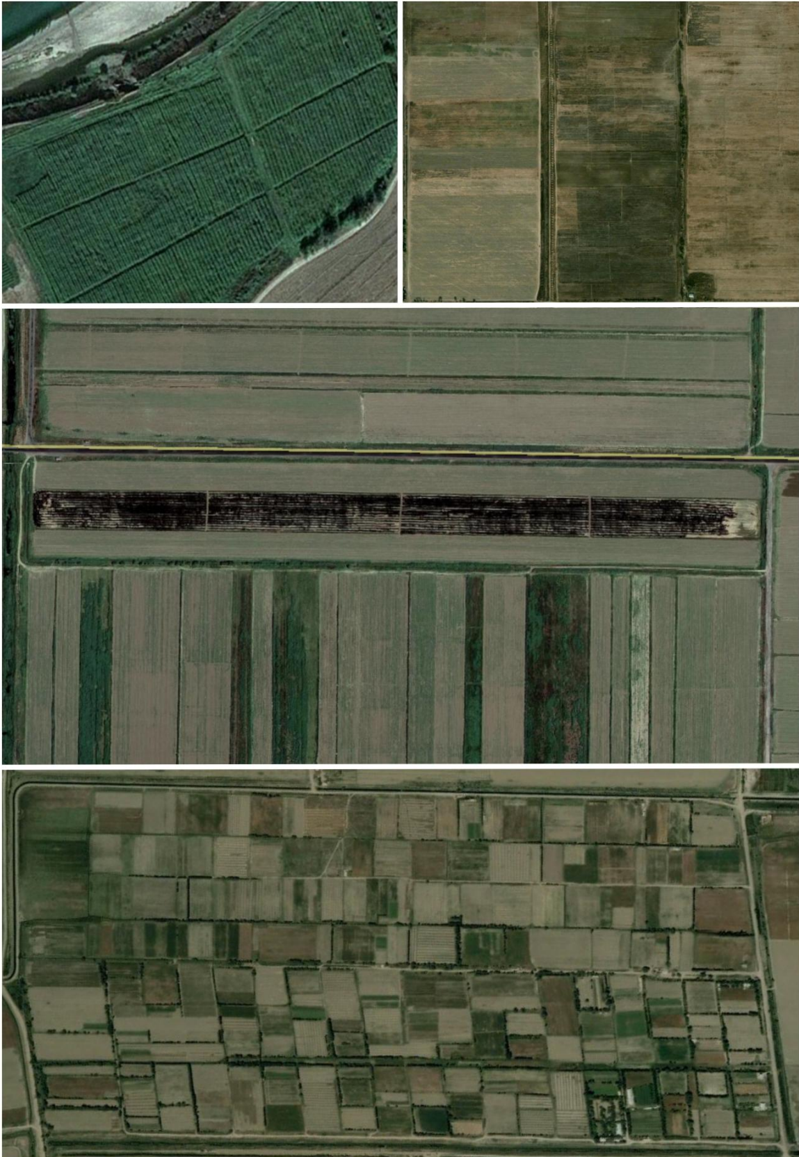
Vista aérea de los lotes y la forma de riego.

El suelo de Uzbekistán es muy diferente al de Argentina. Su agricultura se desarrolla por medio de la irrigación de cultivos. El promedio de lluvias anuales varia en zonas que van de los 90 a 360 mm/año. Se realiza riego por surcos, manto, goteo y por aspersión según el cultivo.