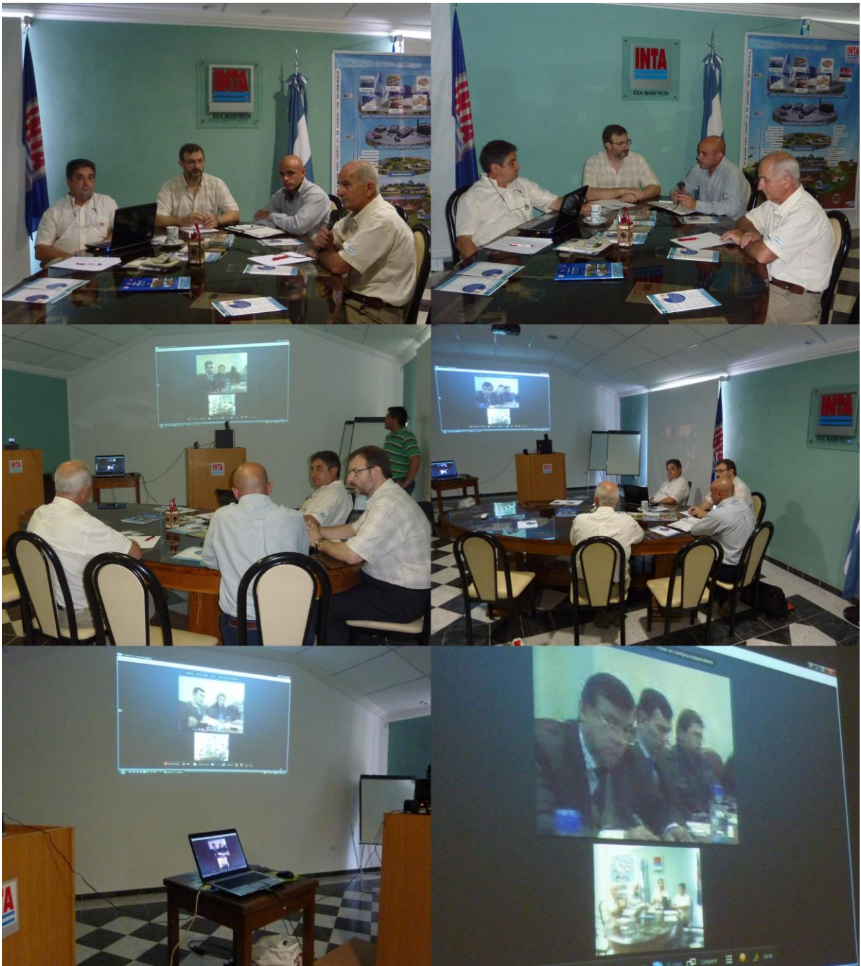
Imágenes tomadas durante la video-conferencia el 03/12/2010 entre las 9 am y las 11:30 am

Temas Tratados: Desarrollo de potencial Agrícola, Posibilidad de inversiones u exportaciones. Estrechar relaciones comerciales y posibles misiones cruzadas.