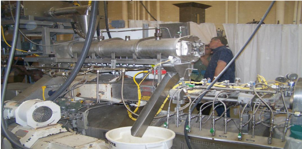
Equipo extrusor con el cual se realizaron las actividades prácticas