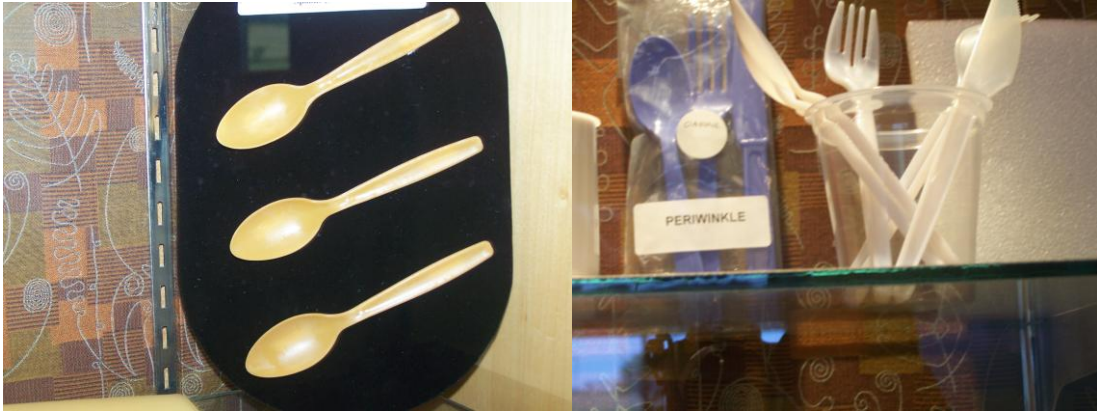
Algunos elementos plásticos obtenidos a partir de soja.