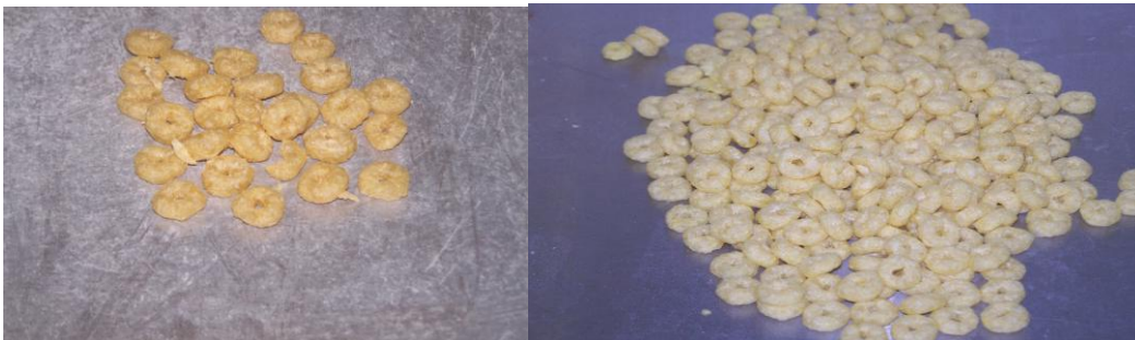
Muestras de algunos productos obtenidos en las actividades prácticas