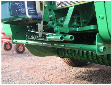
Sistema de doble aguja