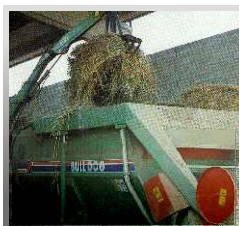
MIXER HORIZONTAL DE UN ROTOR