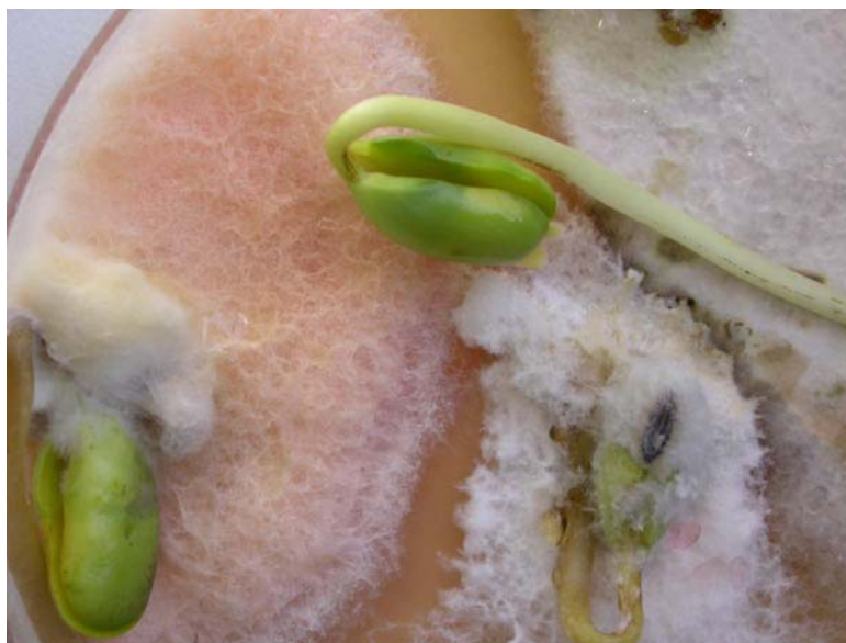
Fig.4. Semillas y plántulas de soja colonizadas por micelios algodonosos de Fusarium sp.

En las últimas campañas, la alta presencia de semillas con Cercospora sojina , hongo causante de la enfermedad Mancha ojo de rana , captó el interés de todos los sectores de la industria semillera. Cercospora sojina se localiza en el tegumento de las semillas siendo la germinación poco afectada. Sin embargo, la importancia de detectar este hongo en los lotes de semillas radica en la diseminación de éste a través de las simientes. Las pérdidas de rendimiento por Mancha ojo de rana pueden ser muy importantes, llegando a alcanzar los 2.000 kg/ha. Por lo tanto, minimizar el ingreso del hongo en lotes de producción es prioritario para reducir el riesgo de ocurrencia de epidemias.