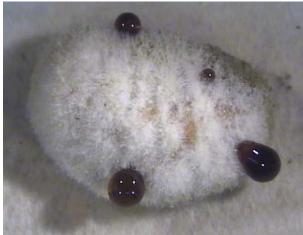
Fig.2. Semilla de soja colonizada por micelio blanco de Phomopsis sp. Cirros emergiendo de los picnidios maduros.

tegumento que facilita la identificación del patógeno aún antes de realizar la incubación de las semillas mediante el Blotter test.