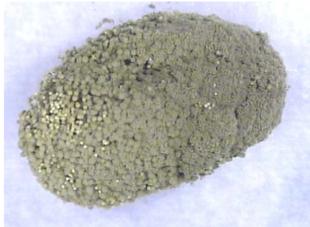
Fig.1. Semilla de soja completamente cubierta por conidióforos de Aspergillus sp.

esta prueba se basa en la determinación del porcentaje de semillas infectadas con un determinado hongo.